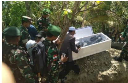
Gambar.1. lokasi pemakaman

Hasil dari negosiasi yang dilakukan antara keluarga dan melibatkan para petinggi dari agama masing masing keluarga, mendapat kesepakatan bahwa almarhum akan dimakamkan sesuai dengan ajaran agama kristen protestan namun demikian keluarga dari agama Islam diberikan kewenangan untuk mendoakan dan melaksanakan tradisi sesuai dengan ajaran agama islam. sebagaimana terlihat pada gambar berikut ini: