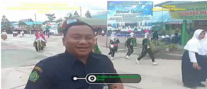
Gambar: 13. Foto MIN Keerom Arso III tampak dari arah depan.