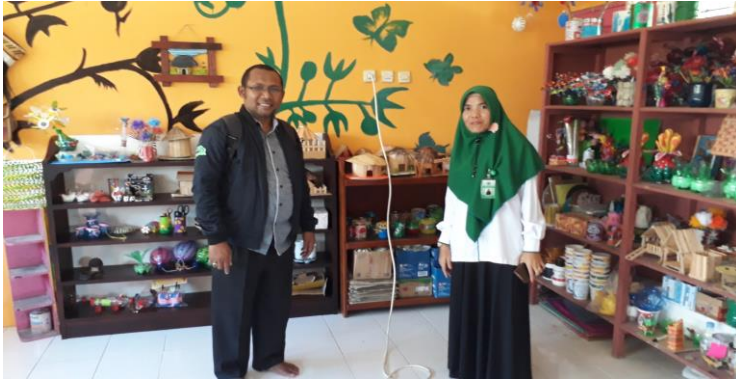
Dokumen.11. Ruang Pokja Daur Ulang 58

mampu menghasilkan berbagai macam bentuk kerajinan tangan yang bernilai ekonomis melalui bahan-bahan bekas.