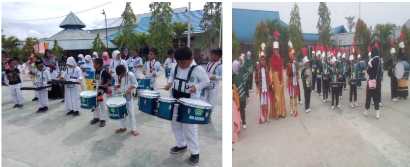
Gambar: 14. Fasilitas ruang terbuka madrasah. 63

Sedangkan fasilitas dalam ruang adalah bangsal tertutup dan sewaktu-waktu dapat dipergunakan sekalipun dalam keadaan hujan atau cuaca buruk. Dalam pengertian fasilitas termasuk pula kolam renang. Pemenuhan fasilitas bangsal senam, ruang bela diri dan lebih-lebih kolam renang namun belum ada disiapkan pada madrasah tersebut.