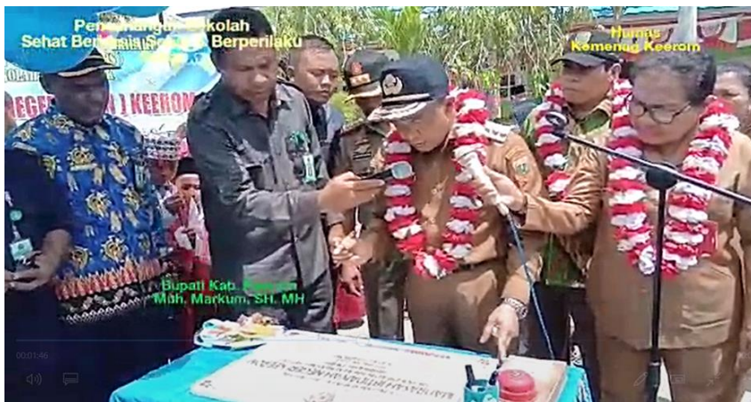
Dokumen. 9. Pencanangan Madrasah berbasis PHBS. 34

pada penyakit (P3P) serta pengenalan dini tanda-tanda penyakit. 33