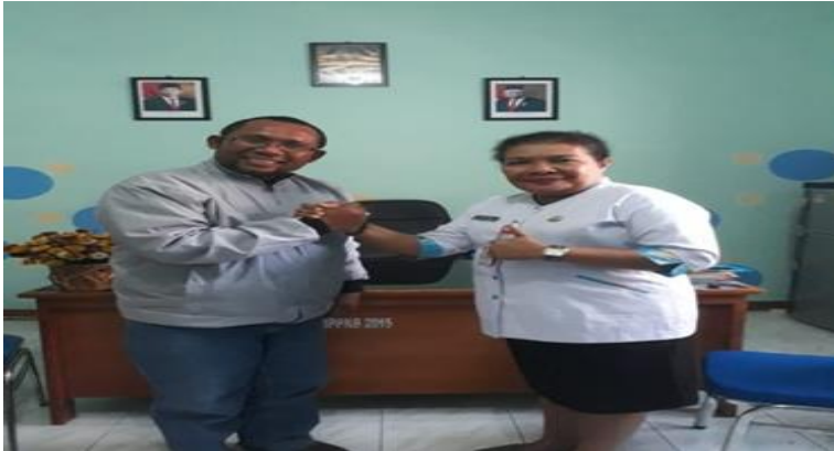
Dokumen. 7 26

Saya sangat mendukung Program perubahan sekolah sehat berbasis PHBS (Perilaku Hidup Bersih dan Sehat) karena merupakan salah satu indikator menuju Kab. layak anak. Harapannya kegiatan ini bisa terrealisasi dan diterapkan di semua sekolah agar tercapainya presentasi peningkatan sekolah ramah anak. 25