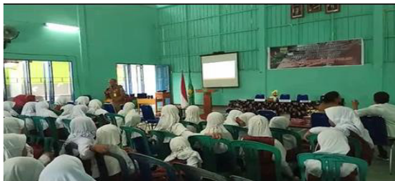
Dokumen. 3 17