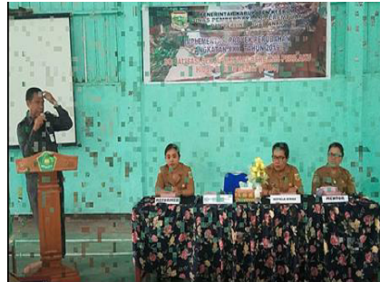
Dokumen: 2 15

Pada tahap perencanaan tim PHBS (Perilaku Hidup Bersih dan Sehat) melakukan: